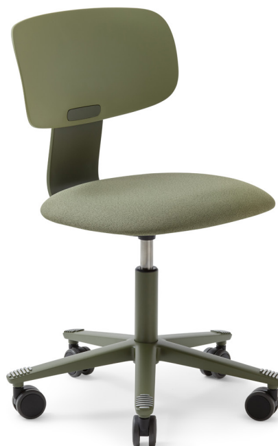
Design: Anderssen & Voll, Hunting & Narud, BIG-GAME und Flokk Design Team.