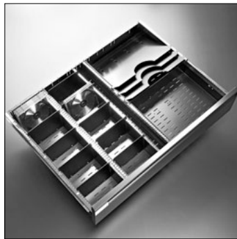
Schwingplatten zu Schublade A6