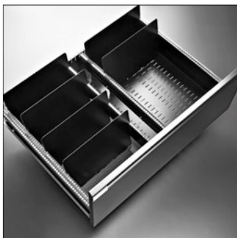
Schwingplatten zu Schublade A4